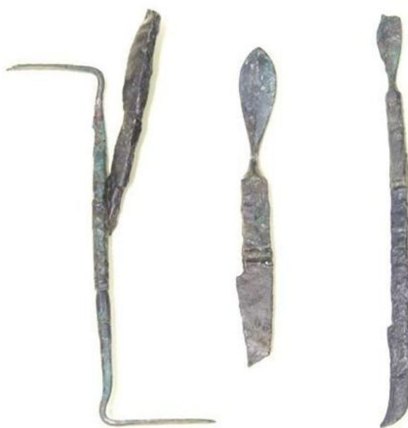
Uno dei pavimenti decorati della Domus del Chirurgo e alcuni degli strumenti chirurgici di età romana rinvenuti nello stesso sito ed esposti nell'attiguo museo

Proseguimento con la visita guidata del centro storico di Rimini: si visiterà l'area romana che comprende il Ponte di Tiberio, l'Arco di Augusto, gli esterni di alcuni degli edifici medievali e rinascimentali più importanti della città: il Palazzo dell'Arengo, il Palazzo del Podestà e lo splendido Tempio Malatestiano progettato da Leon Battista Alberti e dedicato alla celebrazione di Sigismondo Pandolfo Malatesta, signore di Rimini.