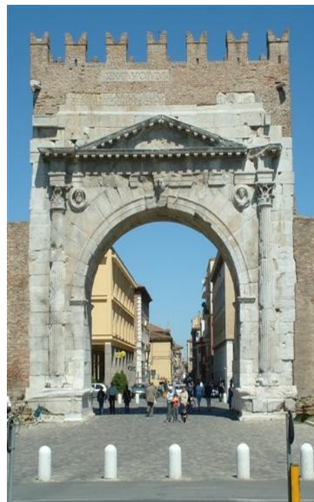
Meraviglie di Rimini: il Tempio Malatestiano, uno dei capolavori del Rinascimento italiano e l'Arco di Augusto, risalente al 27 a.C., il più antico di tutto il mondo romano

Pranzo tipico bevande incluse in un ristorante a Rimini.