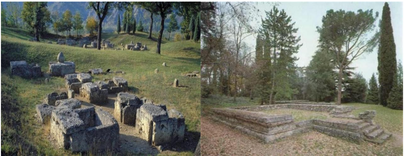
La città etrusca di Misa a Marzabotto: la necropoli e il tempio "D" dell'Acropoli del VI-IV sec. a.C.

In mattinata partenza in pullman Gran Turismo da Torino ( LA PARTENZA DA TORINO E' SOLO UN ESEMPIO: NEL CASO QUESTO VIAGGIO INCONTRASSE IL VOSTRO INTERESSE, CONTATTATECI E VI FORNIREMO UN PREVENTIVO AGGIORNATO CON PARTENZA DALLA VOSTRA CITTA' ) alla volta dell'antica città etrusca di Misa a Marzabotto (BO). Misa è l'unica antica città etrusca esistente ad aver conservato le fondamenta dell'originale impianto urbano (tutti gli altri siti etruschi come Cerveteri, Tarquinia, Chiusi, ecc. sono delle necropoli, ma non vi è traccia dell'abitato) con i grandi viali perpendicolari tra cui spicca il grande "cardo" con una carreggiata di 15 mt. di larghezza. Nel perimetro della città si trovano anche due necropoli (di cui una visitabile) e la sacra area dell'acropoli. Adiacente all'area archeologica si trova anche il Museo Nazionale Etrusco "Pompeo Aria" in cui sono esposti centinaia di reperti (bronzetti etruschi, balsamari, anfore, armi, ecc.) in ottimo stato di conservazione rinvenuti durante gli scavi.