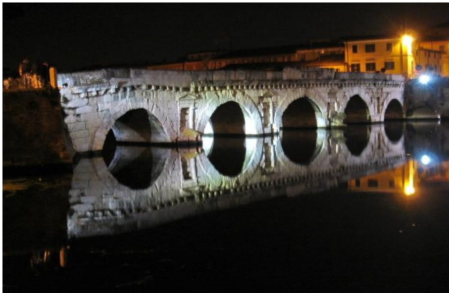
Il ponte romano di Tiberio a Rimini, terminato nel 21 d.C.: sono passati 2000 anni ma ancora oggi è in ottime condizioni (vi transitano le automobili)