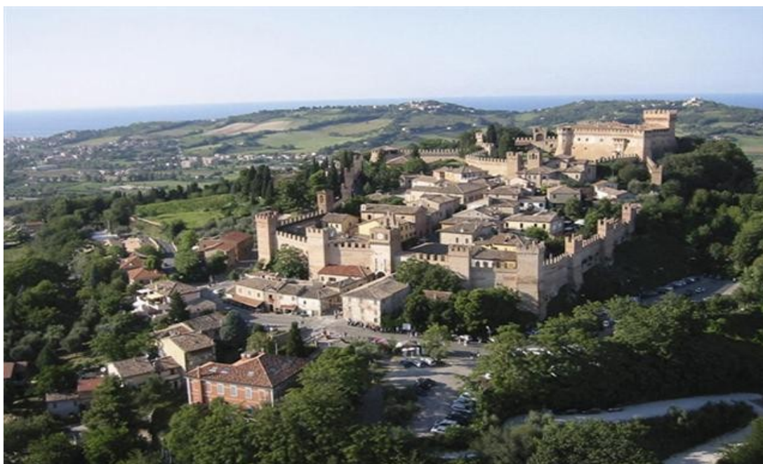
L'intatto borgo medievale di Gradara

Arrivo a Gradara. Ingresso e visita guidata della Rocca.